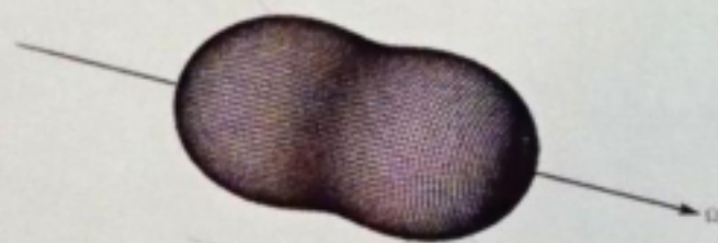
b) 自然光入射の場合のレイリー散乱強度の分布